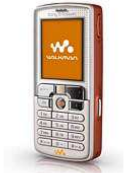
Walkman-Handy W800: Das Original von SonyEricsson mit orangefarbener Schale

Mit ärgerlichen Konsequenzen: Wer die Tastensperre vergisst, hat auf der nächsten Handyrechnung ein paar Euro extra, weil sich das Gerät beim Verstauen in der Tasche selbstständig in das Internet eingewählt hat.